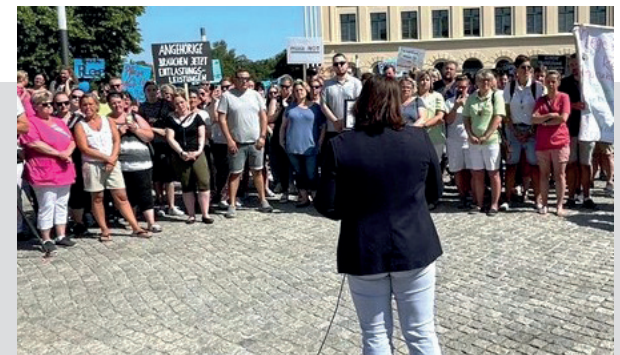
Die Sozialministerin Stefanie Drese diskutiert mit demonstrierenden bpa.Pflegediensten

Rahmen des Pakts für Pflege zu initiieren. Der bpa begrüßt den Pakt für Pflege, sieht es jedoch auch als notwendig an, dass in den AGs konkrete Maßnahmen beraten und letztendlich dem Landespflegeausschuss zur Entscheidung vorgelegt werden. Für die Stärkung der wirtschaftlichen Handlungsfähigkeit ist zudem aus Sicht des bpa unter anderem ein Ausbau der Investitionskostenförderung notwendig. Solche Maßnahmen müssen dann auch mit konkreten Haushaltsansätzen hinterlegt werden. Einen erfolgreichen Pakt für Pflege zum Nulltarif wird es nicht geben können. Für dieses Verständnis wird sich der bpa im Pakt für Pflege aber auch im regelmäßigen Kontakt mit den Regierungsfractionen einsetzen.