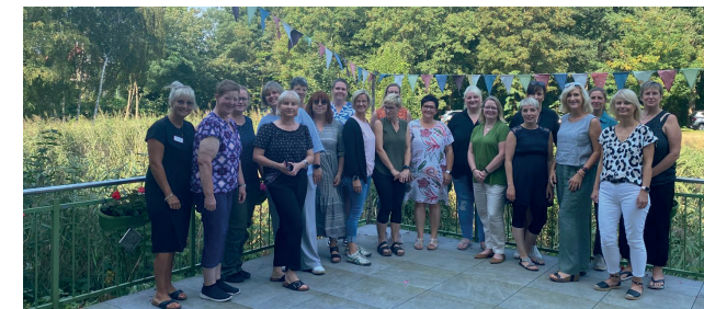
Treffen der Qualitätszirkelleitungen

nicht selbstverständlich und soll an dieser Stelle besonders gewürdigt werden. Ein herzliches Dankeschön an unsere Qualitätszirkelleiter für ihre großartige und wichtige Arbeit. Wir freuen uns stets über den Ausbau unserer regionalen Qualitätszirkel, um den Pflegeeinrichtungen auch zukünftig flächendeckend einen wertvollen externen Austausch im Qualitätsmanagement zu ermöglichen.