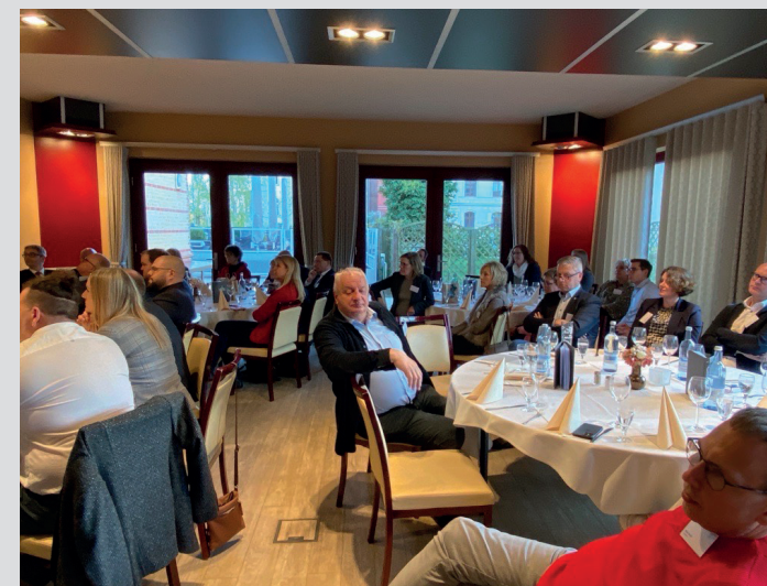
Blick in die Runde der Teilnehmenden

möglichen Unterversorgung in der ambulanten Pflege. Nach den offiziellen Reden folgten intensive Diskussionen, in denen die Teilnehmer ihre Standpunkte erläuterten und Lösungsansätze erörterten. Die Veranstaltung bot auch Raum für informelle Gespräche in entspannter Atmosphäre. Insgesamt markierte der pflegepolitische Abend einen wichtigen Schritt zur Entwicklung tragfähiger Strategien für die Zukunft der ambulanten Pflege.