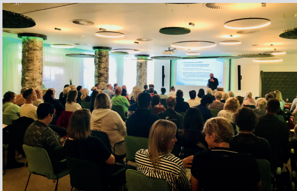
Mitglieder bei einem Infotreff „ambulant“